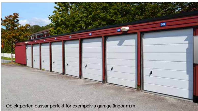
Objektsporten passar perfekt för exempelvis garagelängor m.m.

Grundkonstruktionen kommer ifrån Hörmanns LPU-serie men med ett något tunnare portblad, (42/20 mm). Som tillbehör kan givetvis ASSA-handtag och -lås läggas till. Även ventilationslist kan beställas från fabrik.